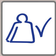
Starke, dauerhafte Klebung