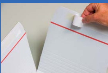
Plus: Sicherheitsklebung innen