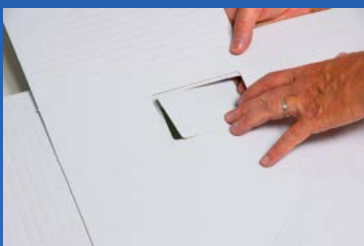
Adressfenster zum Ausbrechen