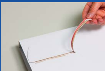
Leichtes, bequemes Öffnen