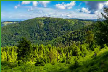
Schont den Waldbestand