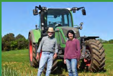
Aus regionaler Landwirtschaft