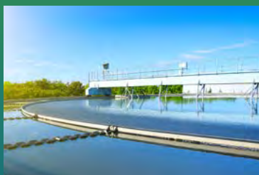
Deutlich weniger Wasserverbrauch