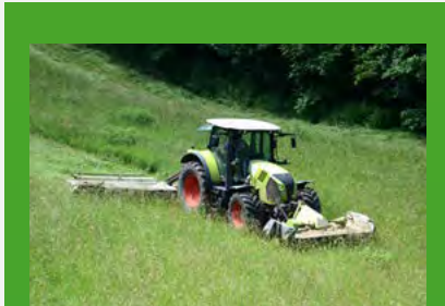
Schnell nachwachsender Rohstoff